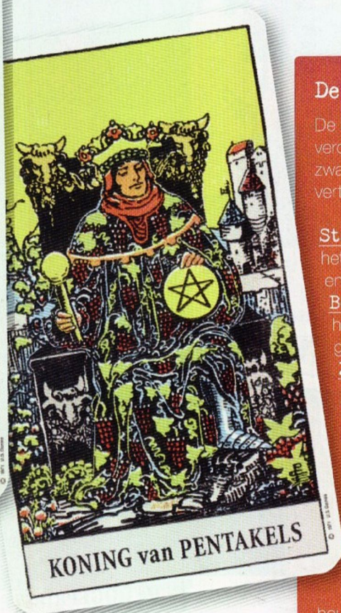
KONING van PENTAKELS

verdiept je een tijdje in het thema van de kaart en laat je erdoor inspireren in je dagelijkse bezigheden.