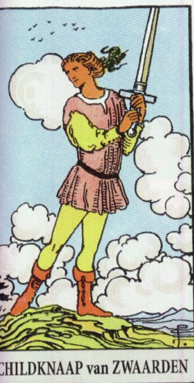
CHILDKNAAP van ZWAARDEN